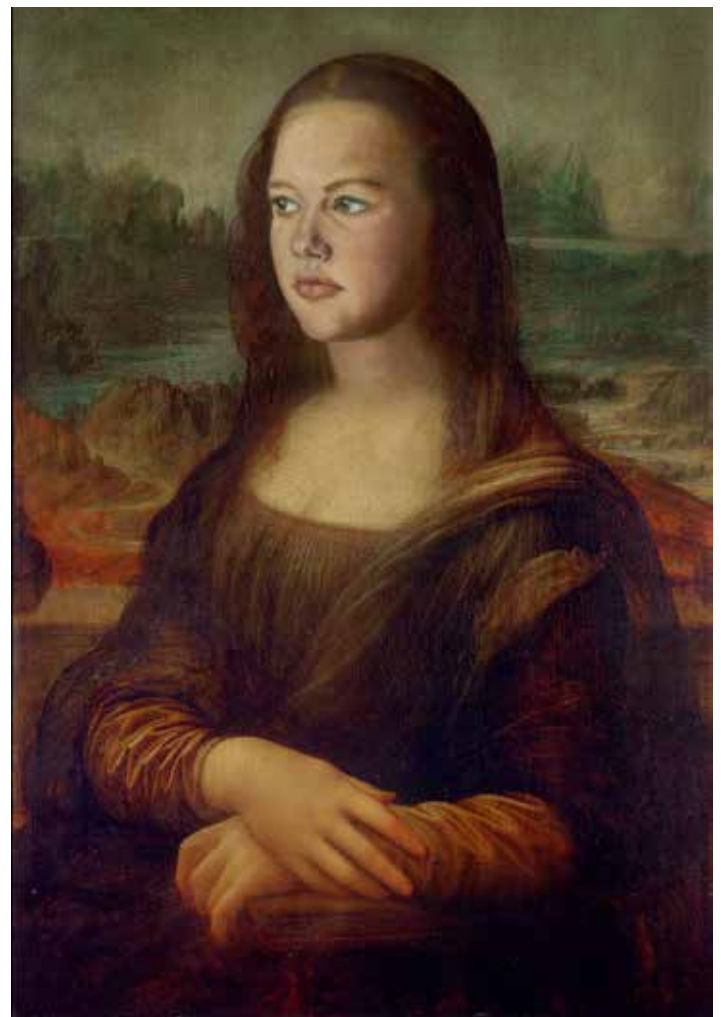
Mona Lisas Nachdenken über die Vergeblichkeit des Strebens nach Kreativität bei untalentierten Künstlern